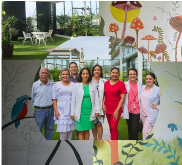
El jardín del Chicho Fábrega