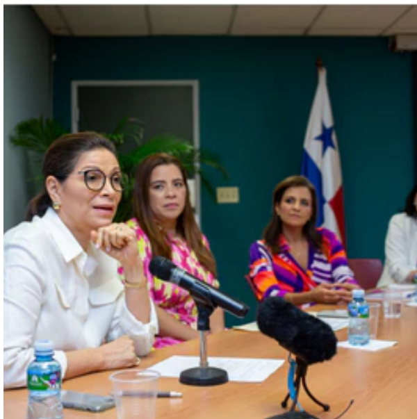
'La mujer que entra a una campaña no es la misma que sale de ella'