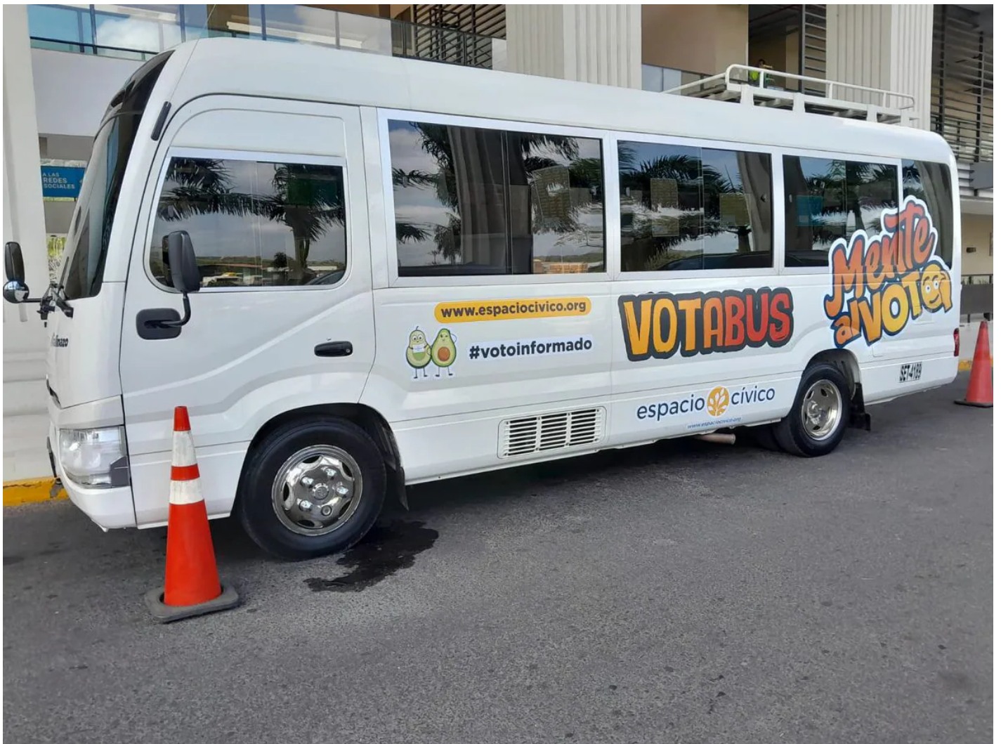
Interior del del Vota Bus. LP Richard Bonilla