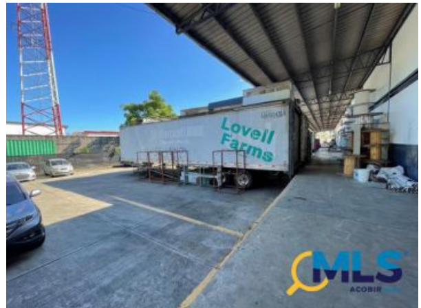
alquiler de galera llano bonito - juan d&iacute;az