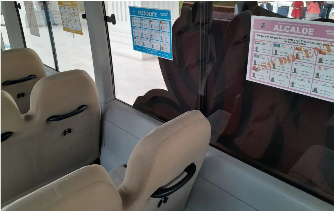
Interior del del Vota Bus. LP Richard Bonilla