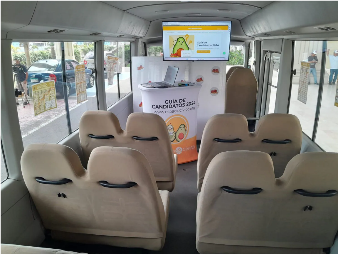
Interior del del Vota Bus.