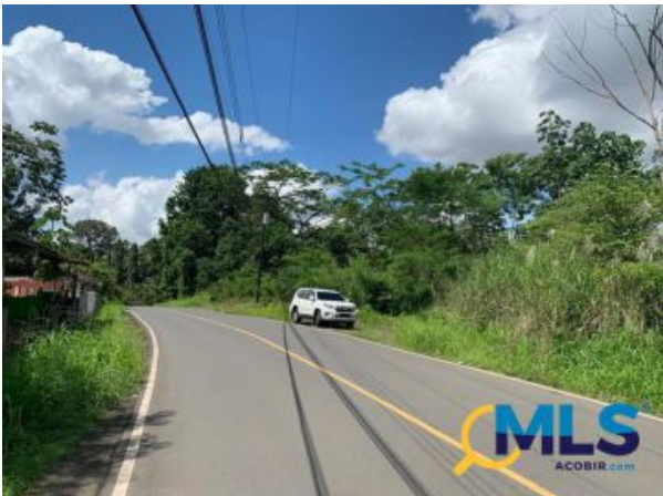
venta de terreno ubicado en bique, arraijan