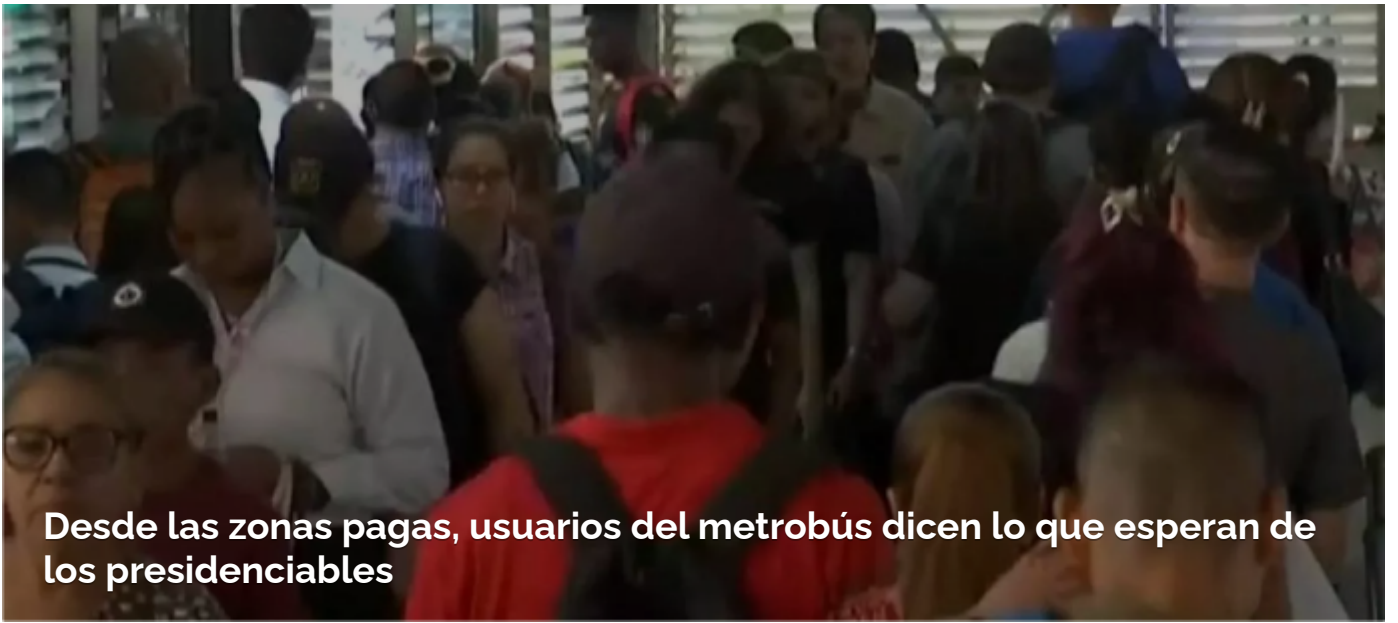
Desde las zonas pagas, usuarios del metrobús dicen lo que esperan de los presidentiables