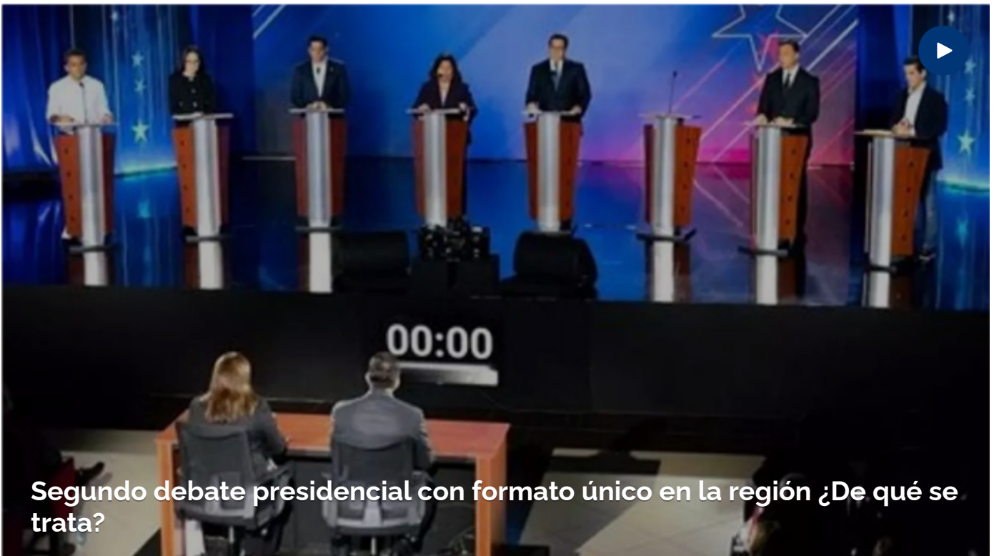
Segundo debate presidencial con formato único en la región ¿De qué se trata?