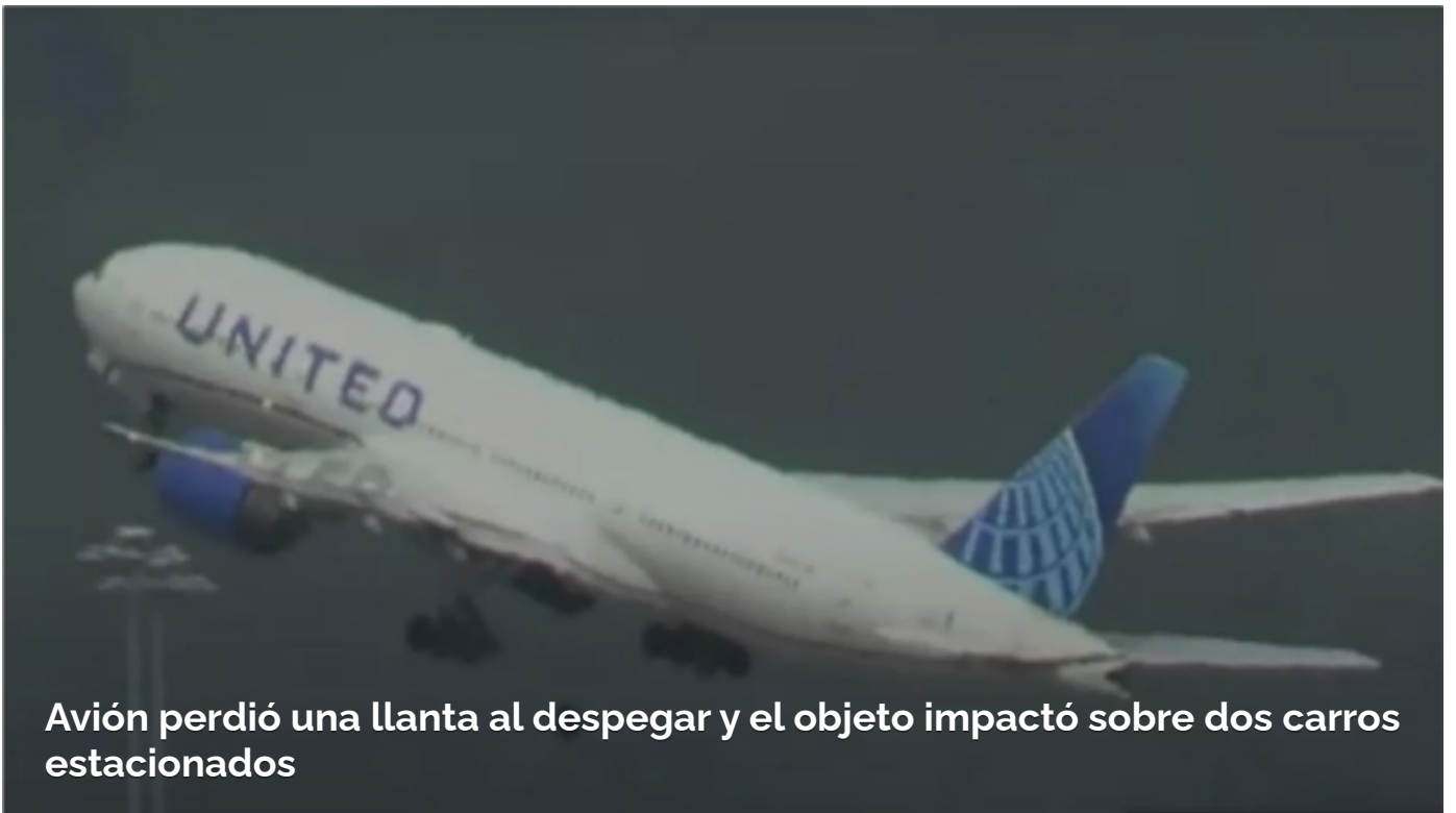
Avión perdió una llanta al despegar y el objeto impactó sobre dos carros estacionados