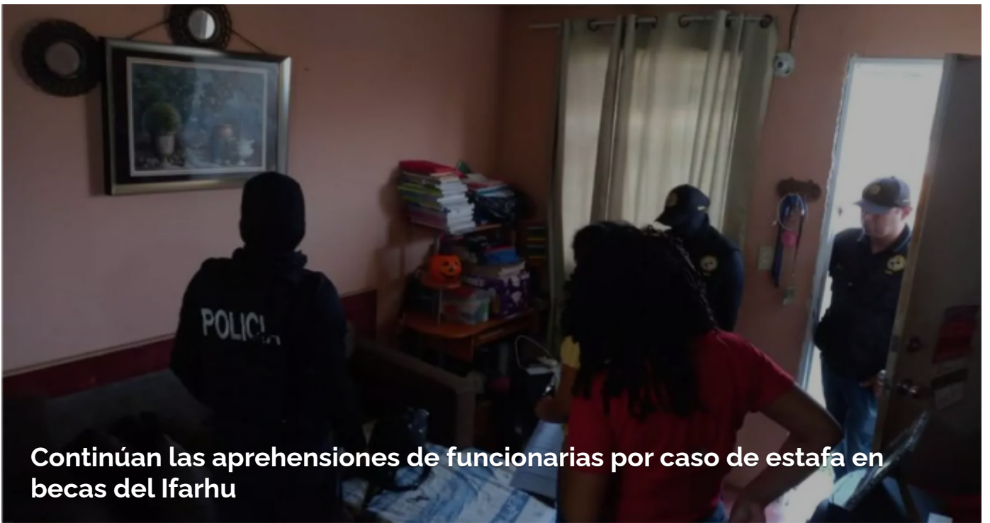
Continúan las aprehensiones de funcionarias por caso de estafa en becas del Ifarhu