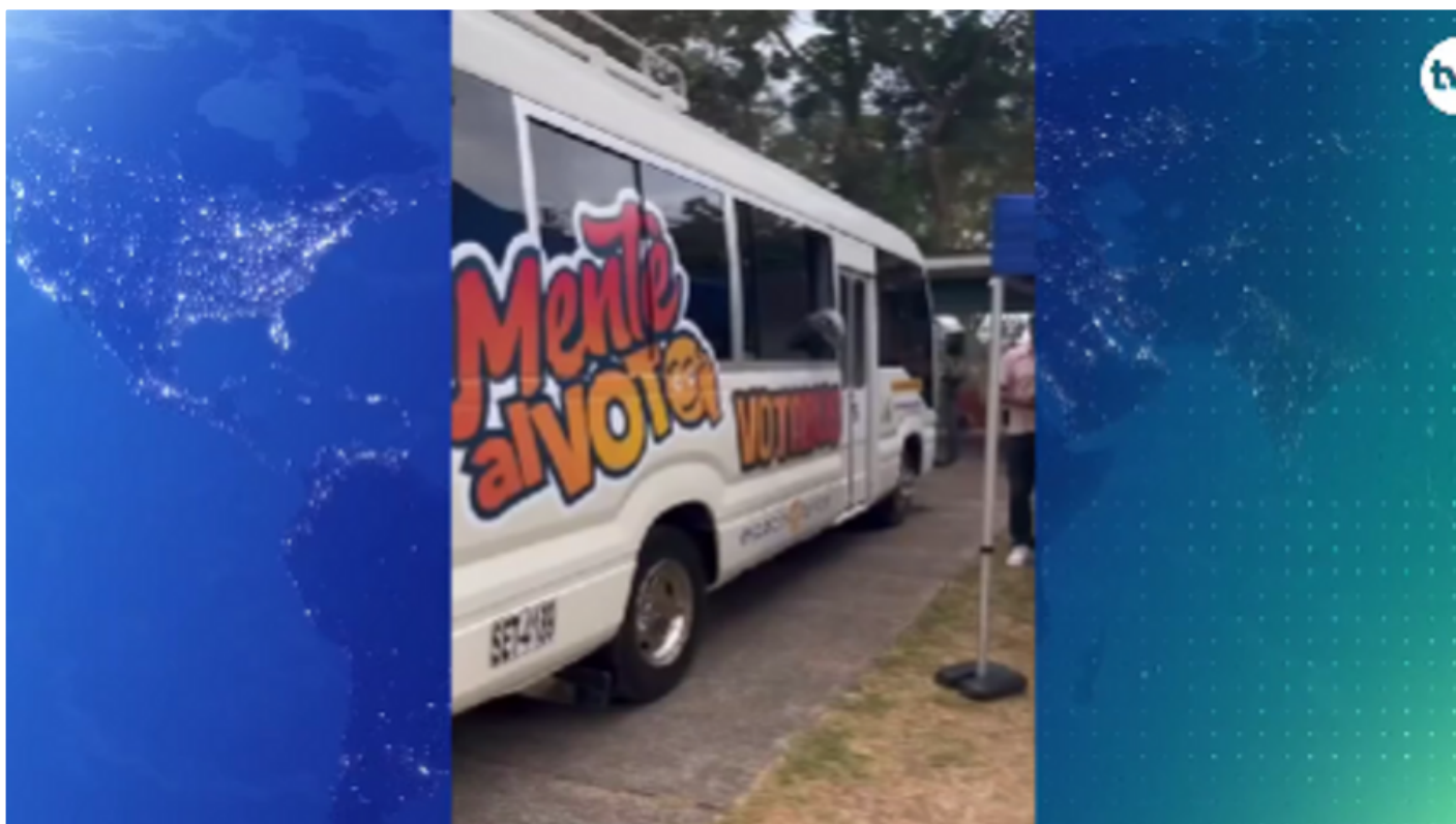
Vota Bus

Asimismo, se enseñará a las personas cómo votar en circuitos que hay entre 40 a 70 candidatos, para que eviten anular el voto al no saber cómo deben votar en este tipo de casos.