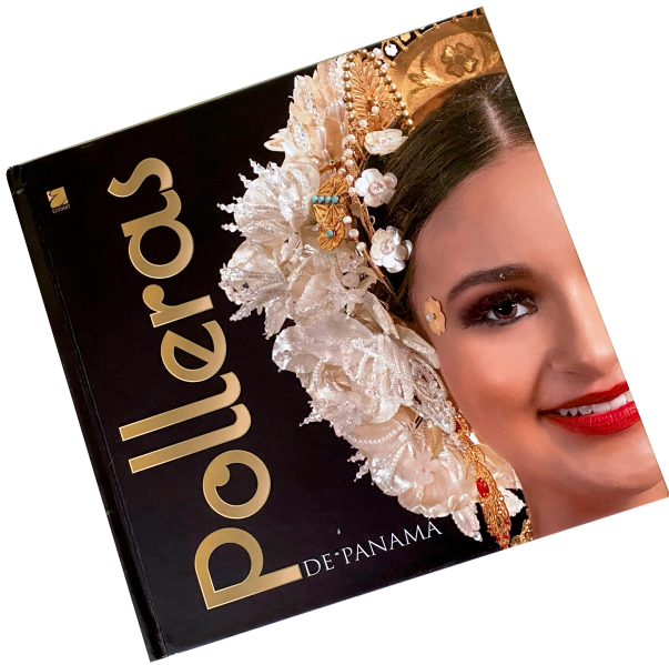
Polleras de Panamá