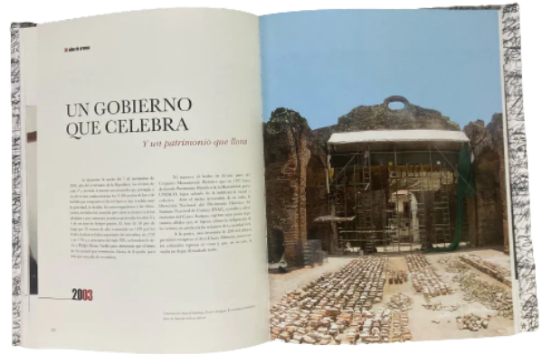
Panamá 30 años de prensa - 30% OFF para socios de Club La Prensa