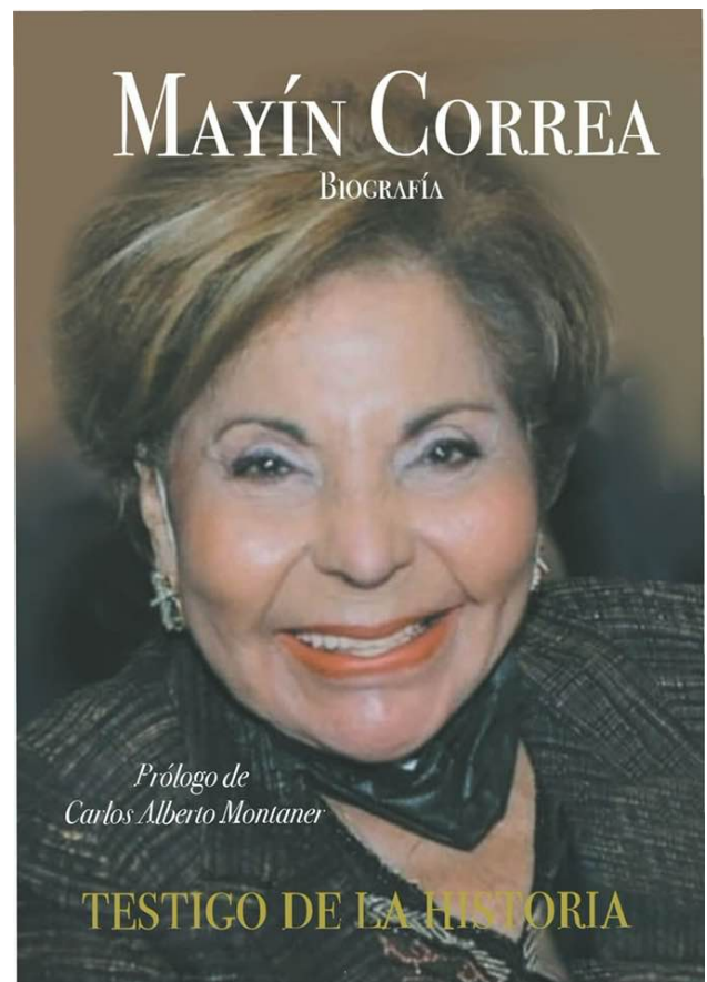
Testigo de la Historia - Biografía de Mayín Correa