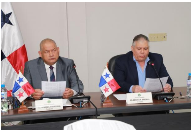
DAN VISTO BUENO A TRASLADOS PARA ATENDER COMP...