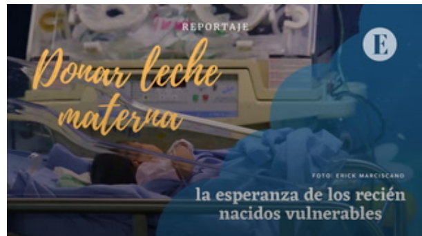
Donar leche materna, la esperanza de los recién nacidos vulnerables