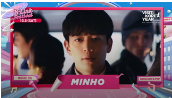
El Festival K-Link celebra la campaña Visita Corea 2023-2024