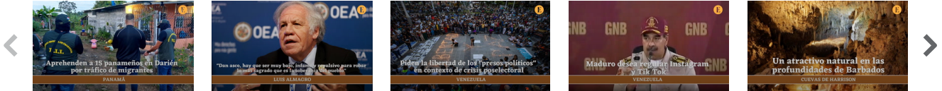
Autoridades aprehenden a 15 panameños en Darién por tráfico de migrantes