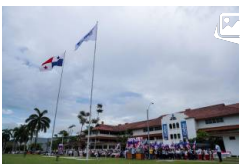
La Ciudad de Saber conmemoró su vigésimo quinto aniversario de fundación con una siembra de banderas en el área de Clayton.