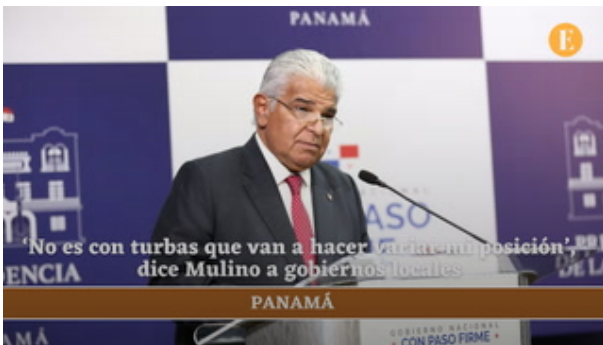
'No es con turbas que van a hacer variar mi posición', dice Mulino a gobiernos locales