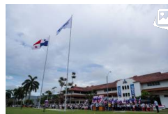
La Ciudad de Saber conmemoró su vigésimo quinto aniversario de fundación con una siembra de banderas en el área de Clayton.