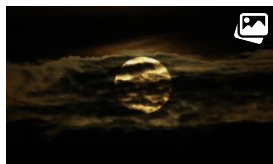
De acuerdo con la NASA, esta Luna Llena fue la "tercera de cuatro superlunas consecutivas y la más brillante por un pequeño margen".