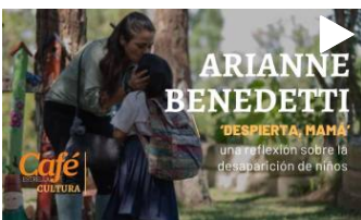
La cineasta habla sobre su nueva película, 'Despierta mamá'. Con el nuevo cargo de viceministra de Cultura, que presidirá a partir del 1 de julio, trabajará...

Arianne Benedetti: 'No dejaré el cine atrás'