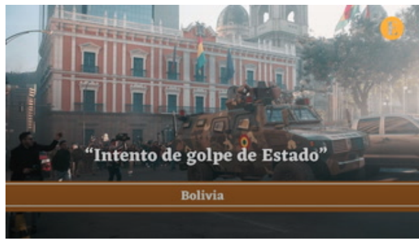
"Intento de golpe de Estado" en Bolivia