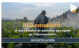
Para conocer los detalles de esta realidad, el Banco Interamericano de Desarrollo (BID) realizará un estudio para entender el comportamiento de países,...

Centroamérica es la región que más utiliza pesticidas por hectáreas en el mundo