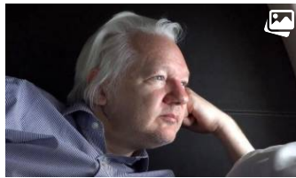
El fundador de WikiLeaks, Julian Assange, aterrizó este miércoles en Australia, su país natal, donde espera comenzar una nueva vida después de alcanzar...

Las grandes etapas de los catorce años de saga judicial del caso Julian Assange