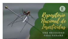
"Repositorio Nacional de Insecticidas, una necesidad para Pana...