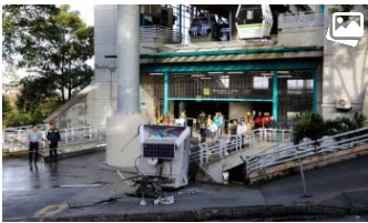
Un persona murió y nueve resultaron heridas tras la caída este miércoles de una de las cabinas del teleférico de Medellín, la segunda ciudad de Colombia,...

Caída de una cabina del teleférico de Medellín deja un muerto y varios heridos