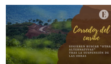
Sugieren buscar "otras alternativas" tras la suspensión del