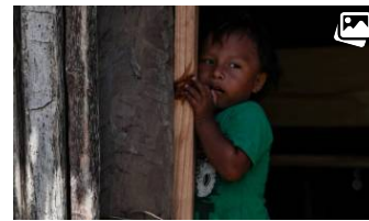
El cambio climático le ganó la guerra a la comunidad de Gardi Subdug con el aumento del nivel del mar en la isla. Por ello, sus residentes fueron trasladados...

De la isla de Gardi Subdug a una urbanización