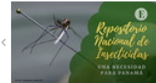
"Repositorio Nacional de Insecticidas, una necesidad para Panamá"