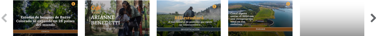
Estudio de bosques de Barro Colorado se expande en 28 países